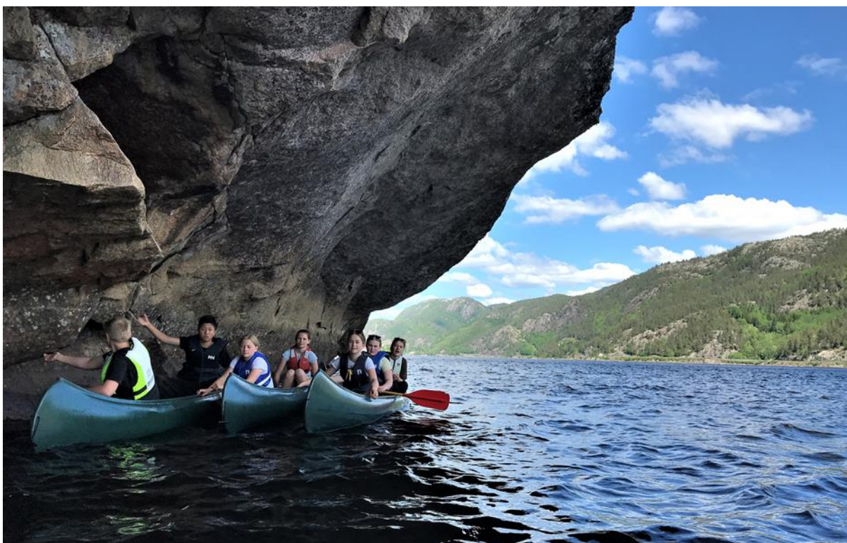
Elevar på kanotur ved Skipheddaren.

Åseral skal vera ein attraktiv kommune for fastbuande og tilreisande. Kommunen har i overkant av 900 innbyggjarar og om lag 2500 fritidsbustader. Desse er i hovudsak knytt til utbyggingsområda i Eikerapen, Ljosland og Bortelid. Tilrettelegging for kommunen sine innbyggjarar og tilreisande må ein sjå i ein samanheng. Det må vere eit mål for anleggsutbygginga å ha rekreasjonsområde og anlegg tilrettelagt for eit mangfald av aktivitetar heile året og for ulike aldersgrupper.