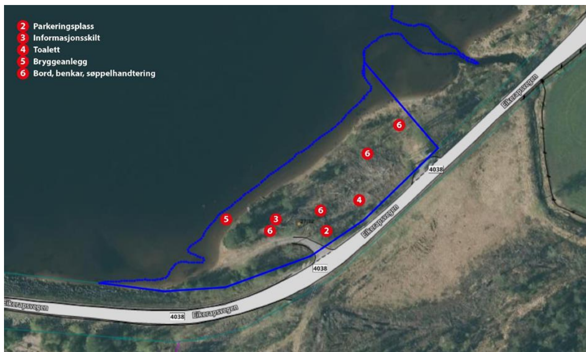
Oversikt planlagde tiltak Fiskland aktivitetsområde.

Status eksisterende anlegg og aktivitetsområde i Kyrkjebygd, Eikerapen, Ljosland og Bortelid pr. 1. januar 2023 blir omtala i dei følgjande avsnitta: