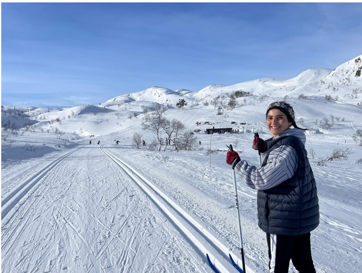
På tur til dagsturhytta og skileikanlegget ved Farevatn, Ljosland.