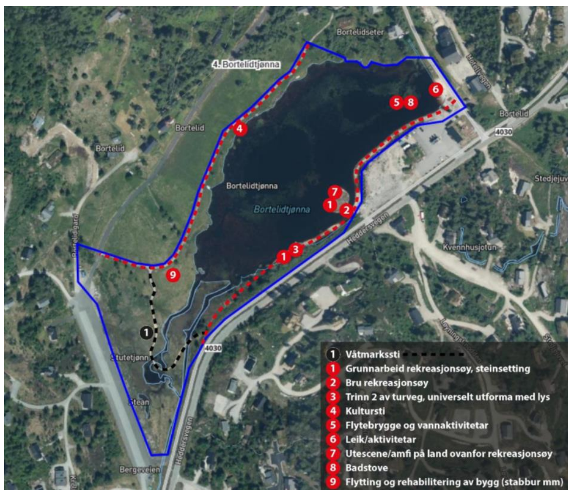
Oversiktskart planlagde tiltak Bortelidtjønn aktivitesområde.