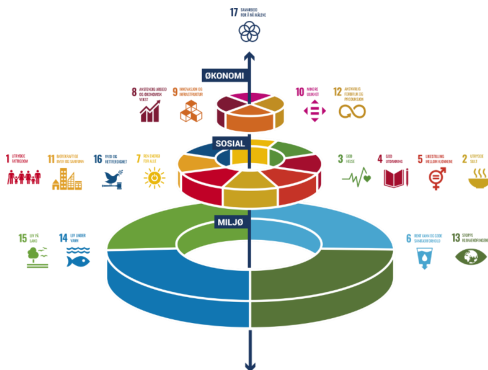
Figur 1: FN sine berekraftsmål kategoriserer på dei tre områda «miljø», «økonomi» og «sosiale forhold».

Regjeringa har ambisiøse mål for klima, miljø og berekraft. Regional og kommunal planlegging er gode verktøy for å utvikle eit meir berekraftig samfunn og til å vege interesser og omsyn mot kvarandre. 2030-agendaen med dei 17 berekraftsmåla dekkjer alle samfunnsområde, og kan bidra til gode prioriteringar i usikre tider. Noreg har slutta seg til 2030-agendaen med 17 mål for å fremje ei sosialt, miljømessig og økonomisk berekraftig utvikling. På figuren nedanfor er 16 av berekraftsmåla fordelt på desse tre formene for berekraft. Berekraftsmål nummer 17, «Samarbeid for å nå måla», gjeld for alle tre formene.