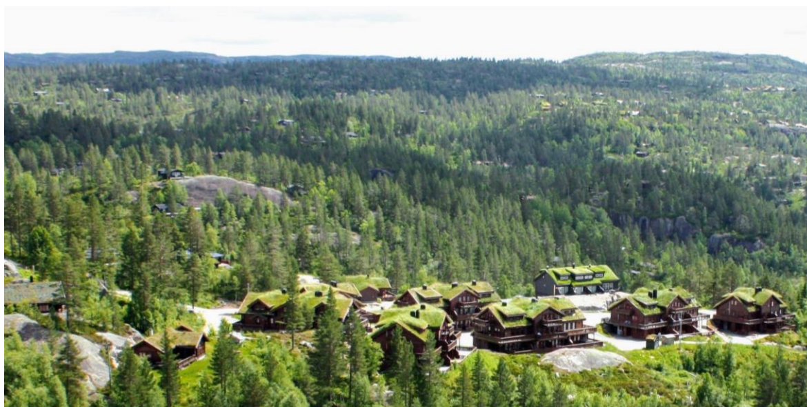
Figur 8: Hyttefelt.

I Åseral er det nokre stader store avstandar mellom der folk bur, og til dømes kor butikken, skulen eller arbeidsplassen ligg. Å køyre bil er ei transportform mange nyttar seg av. For at dei som køyrer skal kome seg trygt fram, er det viktig å sikre god standard på vegane. I dag er det fleire smale og bratte vegstrekningar i kommunen. I arealdelen vil det vere aktuelt sjå framtidig utvikling opp mot eventuell utbetring av vegareal for å auke trafikktryggleiken. Ifølge samfunnsdelen skal det vidare arbeidast for gode gang- og sykkelveggar. Å skape eit godt og tilgjengeleg kollektivtilbod i heile Åseral er også eit mål. Samstundes må løysningar knytt til ulike transportformer tilpassast distriktet. Kor ein planlegg for ulike arealformål, og korleis desse plasserer seg i forhold til kvarandre vil i den samanheng vere viktig.