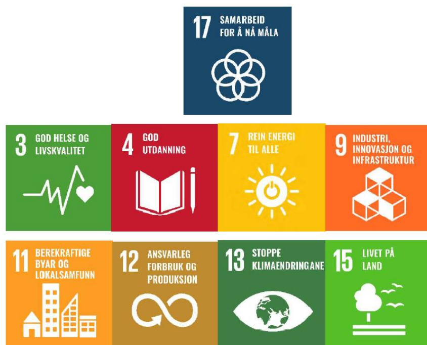
Figur 2: Berekraftsmål Åseral kommune vil satse spesielt på i komande planperiode

Nedanfor visast berekraftmåla som Åseral kommune vil satse spesielt på i komande planperiode. Desse berekraftsmåla er vald ut i planprosessen fordi dei er svært relevante for kommunen, og er direkte kopla mot måla kommunen har satt seg.