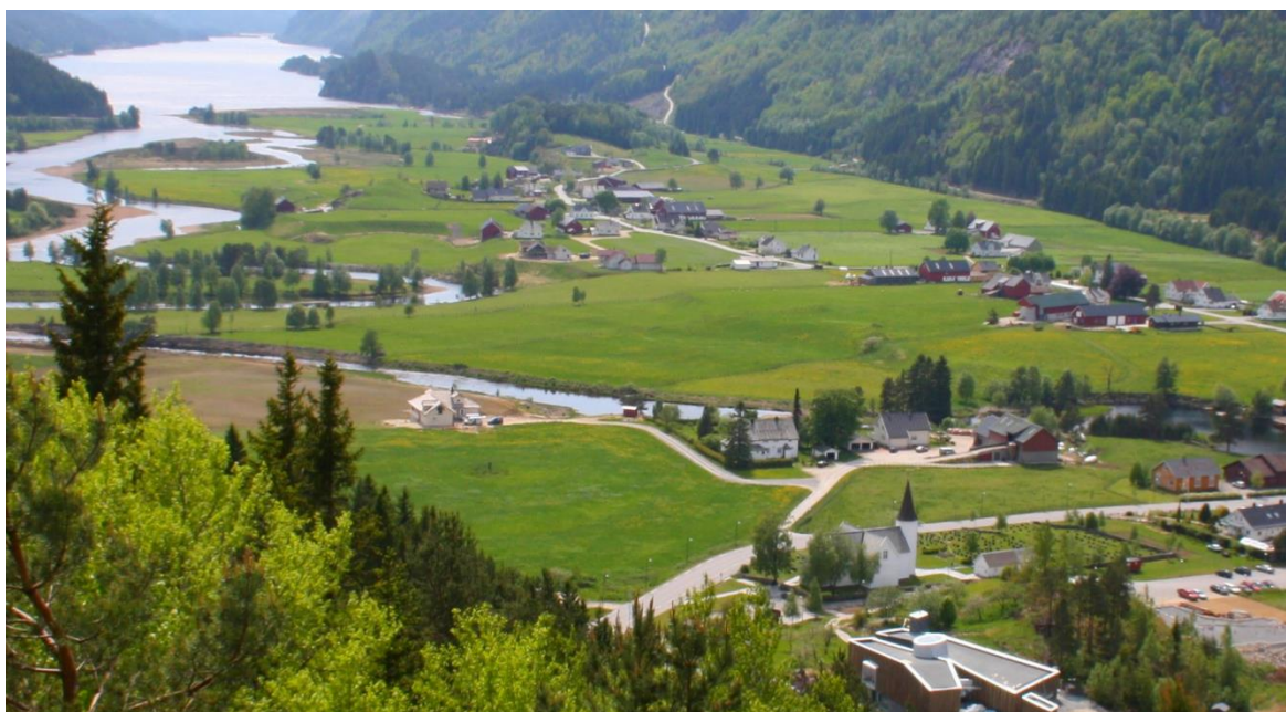
Figur 4: Utsikt sørover frå Kyrkjebygda.