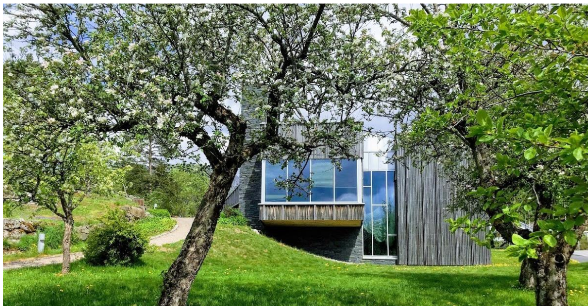
Figur 6: Minne kultursenter.

Også sentrumsnære område og mindre grender og lokalsamfunn treng gode, aktivitetsskapande møteplassar. Det skal leggjast til rette for møteplassar i/ved Lognavatn grendehus og Kylland grendehus, og elles skal det være mogleg å utvikle møteplassar tilpassa lokale forhold i dei ulike grendene.