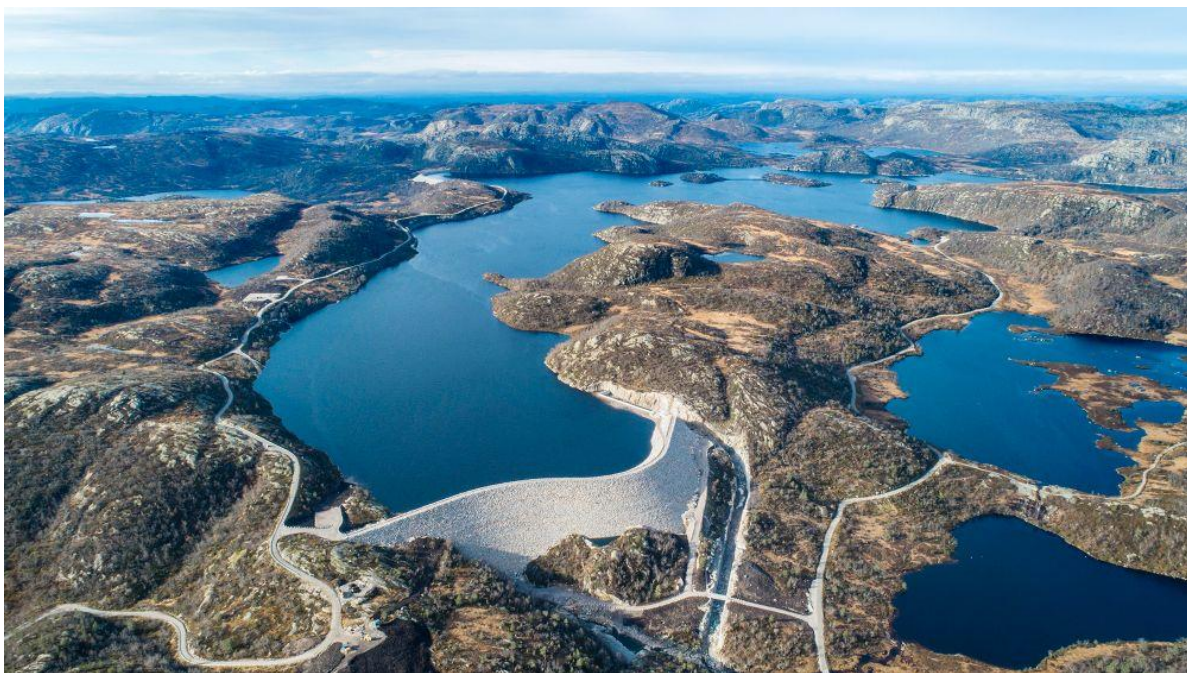
Figur 5: Skjerka vasskraftverk.