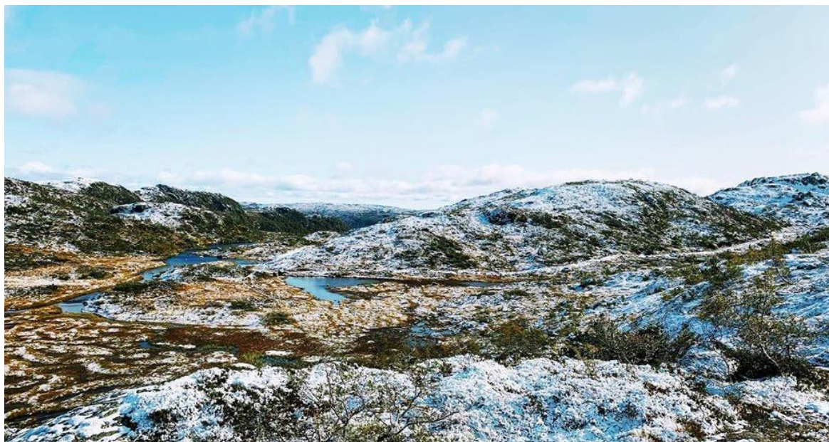
Figur 7: Utmark.